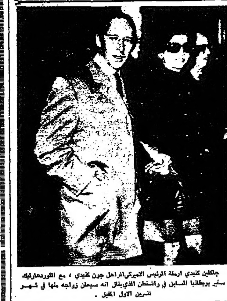
جكبن كندي ارملة الرئيس الأميركي الراحل جون كينيدي ، مع اللورد هارليك سكر بريطانيا السابق في واشنطن الذي يقال انه سيعان زواجه منها في شهر تشرين الاول المقبل .